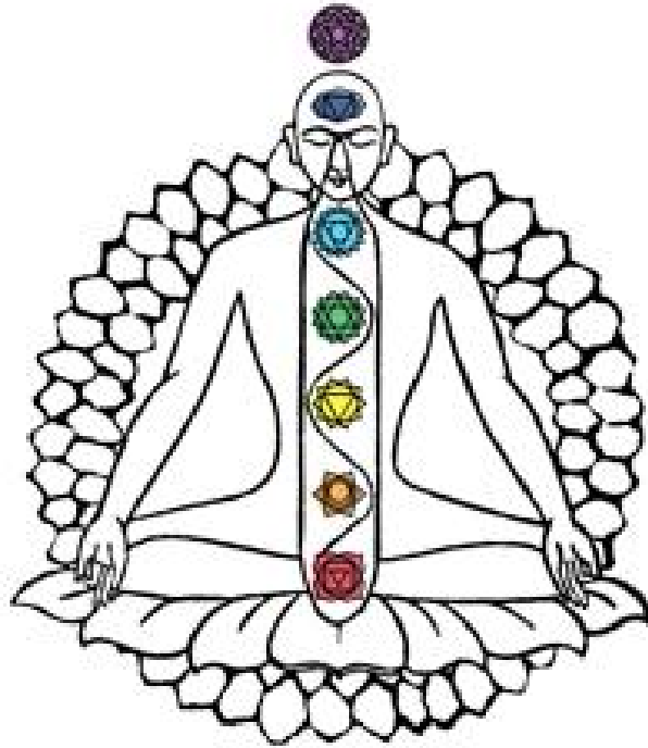
Chakras – kroppens energisystem

Sanskrit namn: = Sahasrara Färg: = Violet Färgfrekvens: = 790 – 700 THz